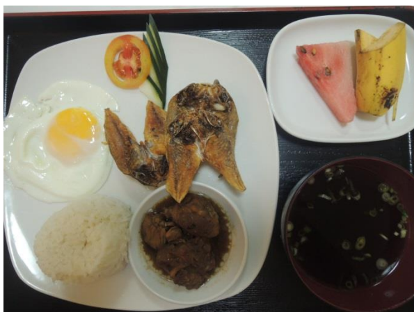
写真は目玉焼きとダンギット・チキンアドボの例