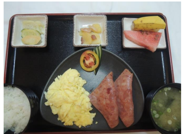
写真はハムとスクランブルエッグの例