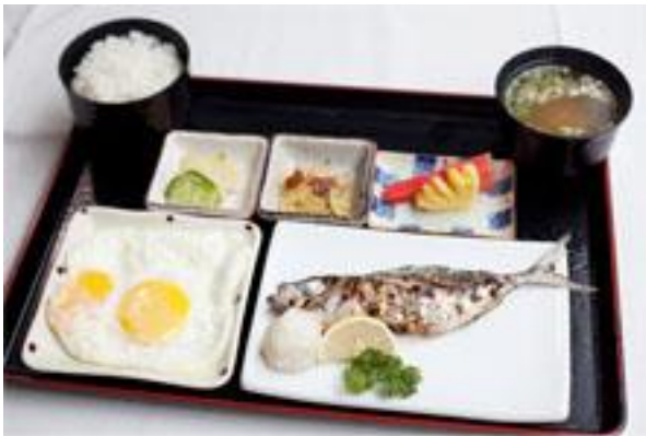
写真はアジ塩焼きと目玉焼きの例