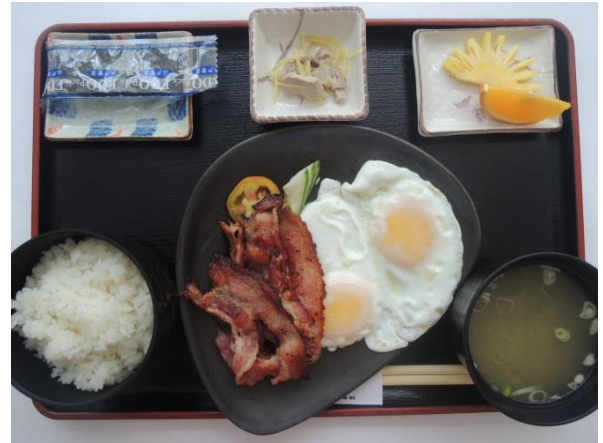
写真はベーコンと目玉焼きの例